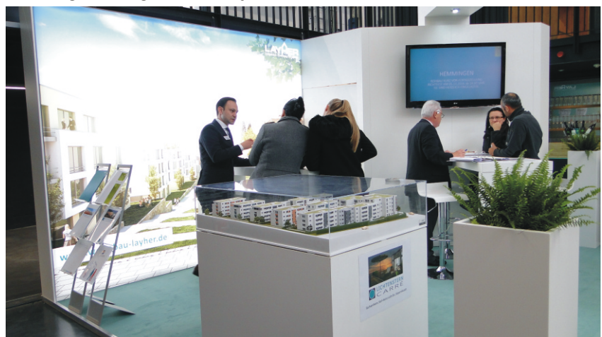
Die Modelle der Layher-Projekte als Besuchermagnet

aus: Ludwigsburger Kreiszeitung vom 24.10.2016